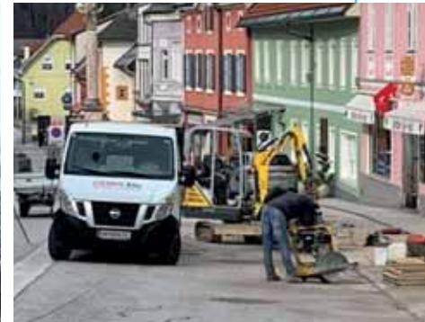
Fundamente für Zelt am Hauptplatz