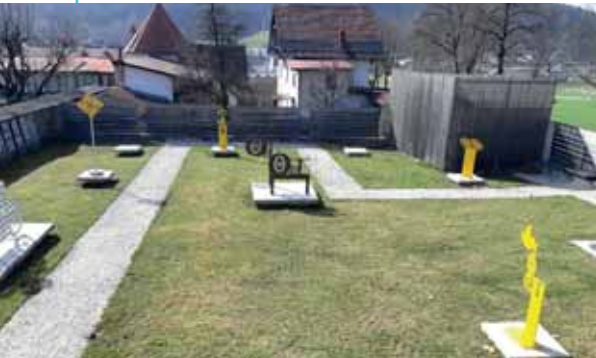
Carinthija 2020 Skulpturenpark

Ich wünsche Ihnen ein schönes Osterfest - bleiben Sie gesund.