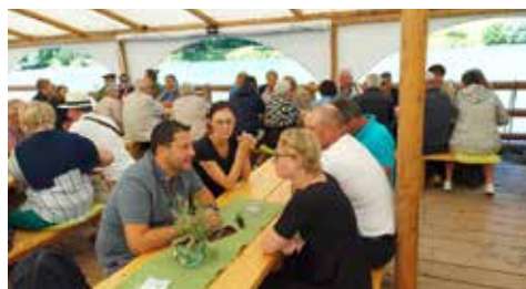
AUSFLUG 2022: Eine Flossfahrt von Lavamünd nach Dravograd und anschließender Besuch des Museums Liaunig waren die Attraktionen des ÖVP Bleiburg Ausfluges 2022.