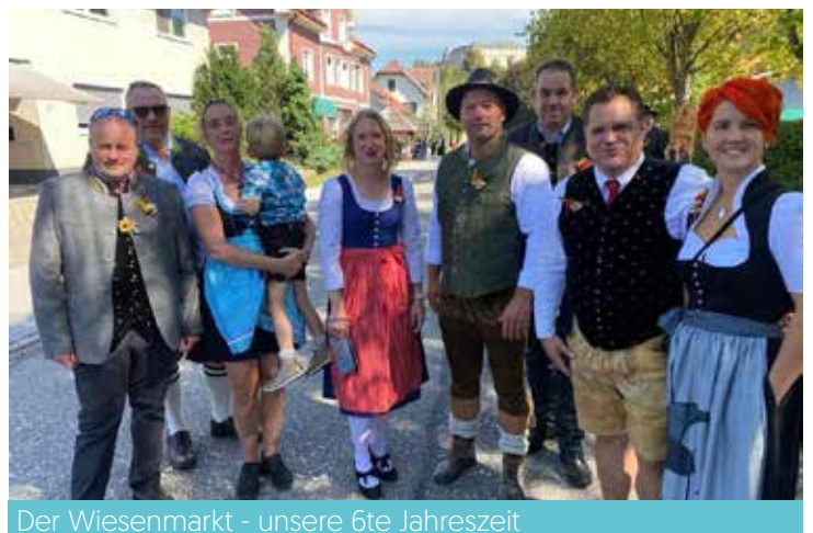
Der Wiesenmarkt - unsere 6te Jahreszeit